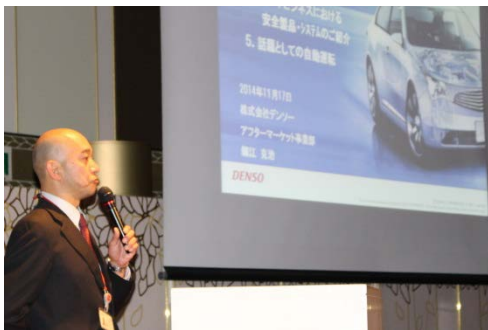
講演①「デンソーが考えるもっと安全な車社会へ」