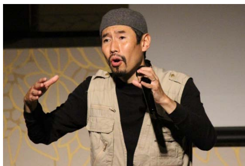
フォトジャーナリスト・戦場カメラマン 渡部 陽一氏