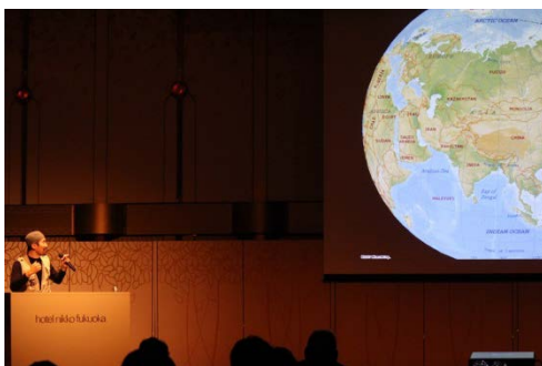
講演②「石の上にも15年〜コツコツ続ける力」