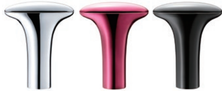
シルバー ワインレッド ブラック