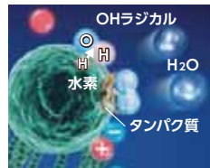
浮遊カビ菌分解・除去イメージ

浮遊カビ菌表面の細胞膜のタンパク質を切断して分解・除去し、除菌します。 約31m 3 (約8畳相当)の試験空間での約83分後の効果です。