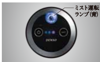
ミスト運転ランプ(青)