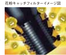
花粉キャッチフィルターイメージ図

※10 \mu m以上の粒子を約80%捕集するフィルターです。(スギ花粉の大きさ:約30 \mu m) 上記除去率は下記条件でフィルターを1回通したときの除去効率です。 条件:5~10 \mu m粒子(JIS11種)を重量法(JISB9908形式3)で計測